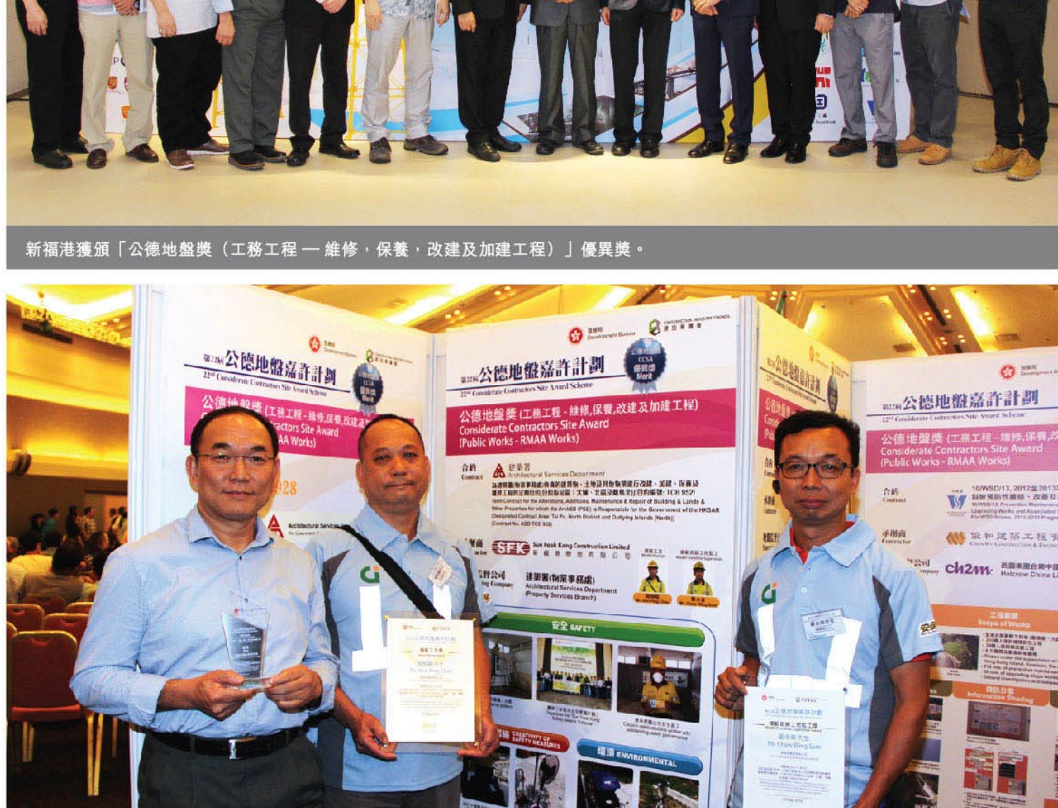
新福港獲頒「公德地盤獎(工務工程—維修、保養、改建及加建工程)」優異獎。

由發展局及建造業議會聯合舉辦的「第22屆公德地盤嘉許計劃」頒獎典禮於2016年5月27日假九龍灣國際展覽中心舉行。新福港承接建築署的一份定期合約獲頒「公德地盤獎(工務工程 — 維修、保養、改建及加建工程)」優異獎，肯定了新福港於職業安全及環境保護方面的表現。