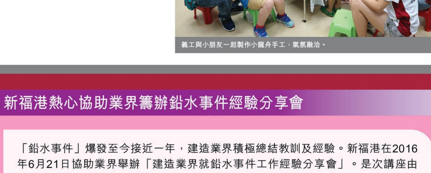
義工與小朋友合照。

適逢端午佳節，新福港與香港耀能協會於2016年5月28日合辦「同舟共製」賀端午義工活動，透過不同的集體遊戲及手工製作，鼓勵患有自閉症和發展障礙的兒童與外界溝通交流，讓他們體驗群體生活的樂趣。