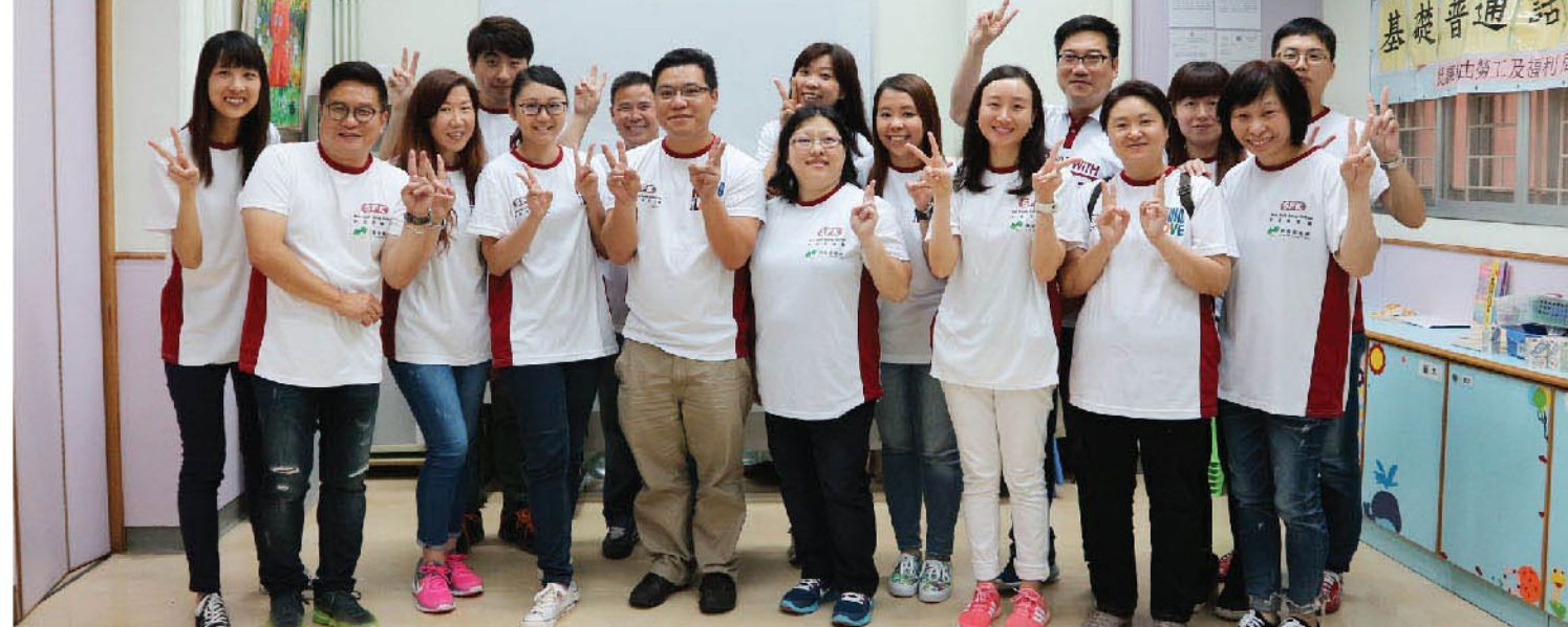
香港紅十字會代表感謝新福港一眾參與捐血的員工。

隨著人口增長，香港血液需求量與年俱增。捐血是一項公益事業，可以讓病危的人重拾生命，為社會傳遞更多的正能量。新福港在做好各項業務之餘，亦會承擔社會責任，積極鼓勵員工參加捐血、義工等社會公益活動，用愛心及真誠回饋社會。