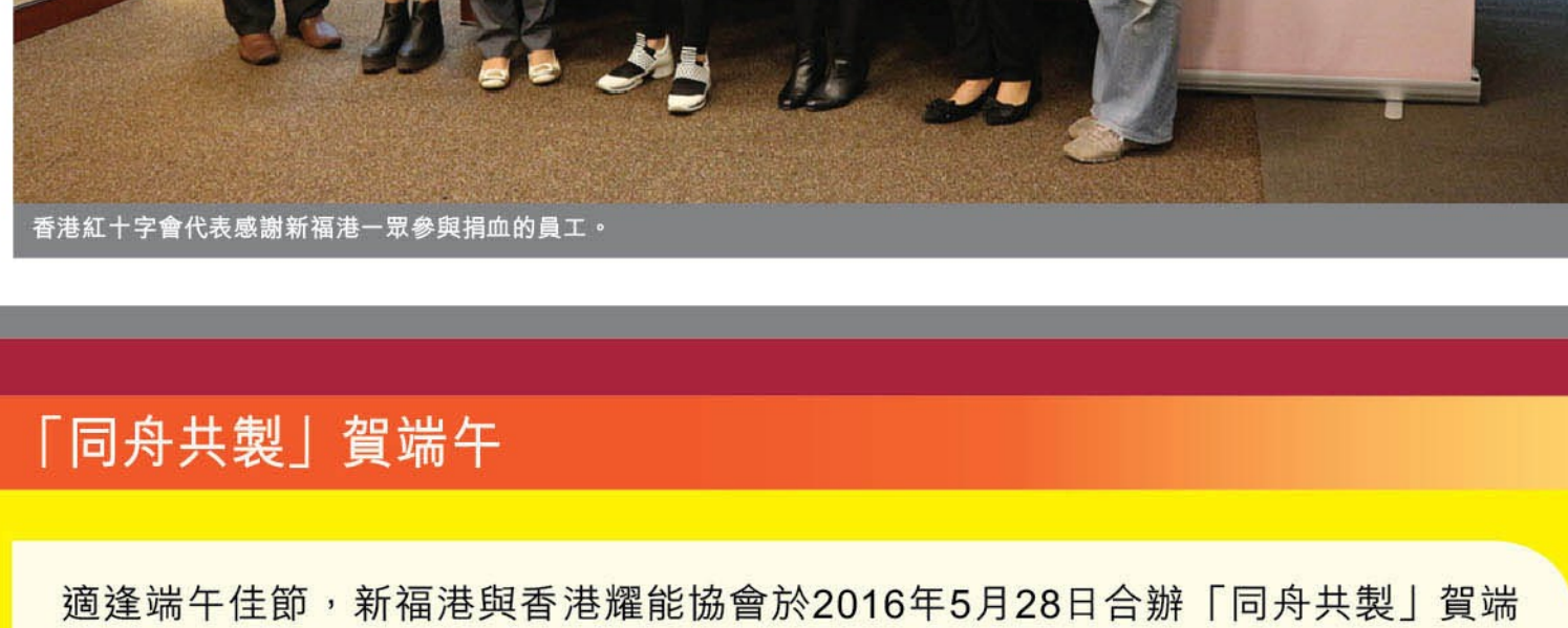
參與是次捐血活動的新福港員工合影。

為響應香港紅十字會的呼籲，鼓勵員工加入捐血行列，並讓員工明白「捐血救人、人人有責」，新福港於2016年4月21日組織員工參與紅十字會的捐血活動，鼓勵員工身體力行體驗助人的樂趣。