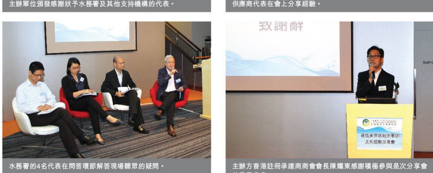
分享會獲得業界踴躍支持，超過150名來自不同建築公司的管理層及工友參與。

鉛水事件令受影響樓宇的居民對供水系統失去信心，為政府及建造業帶來巨大挑戰。為此，是次分享會邀來水務署、供應商、水喉匠及承建商的代表發言，以集結政府及建造業界的智慧。分享會上，各代表積極分享經驗，務求令市民恢復對食水水質的信心。